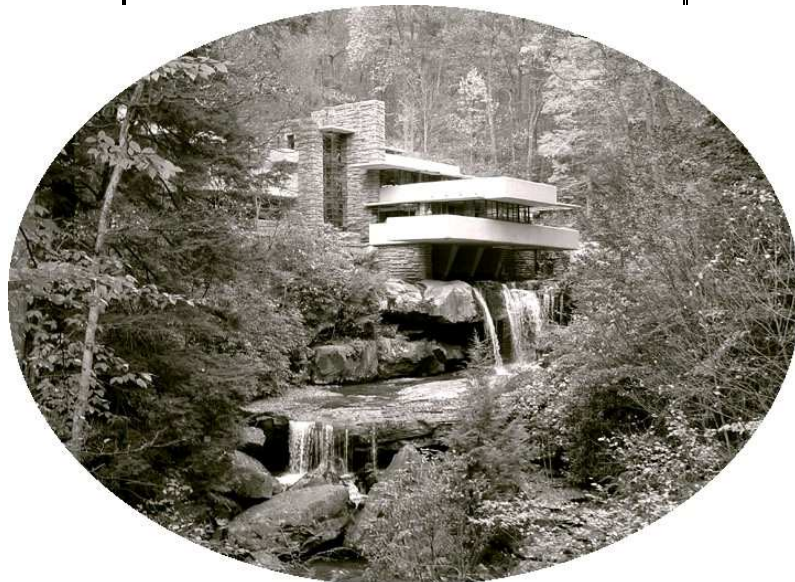
Frank Lloyd Wright, Residência Kaufmann (Fallingwater) em Bear Run, 1936